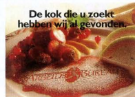
3. „De ... die u zoekt hebben wij al gevonden.“