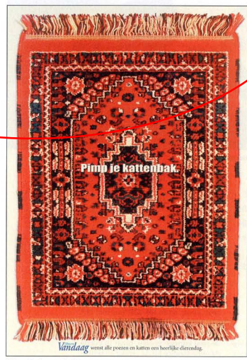
'Pimp je kattenbak'

ALMERE VANDAAG Doelstelling: Inhaken op diervendag Medium: Dagblad Opdrachtgever: Almere Vandaag Bureau: Zaai creatief bureau Creatie: Arno de Jong, Aleksander Willemse Account: Ilze Ligtenberg Dtp: Jeroen Rep Verantwoordelijk bij klant: Dhr. Bouterse Verhaal: Almere Vandaag plaats een inhaakadvertentie op diervendag. De gratis ochtendtabloid biedt voor deze aanleggenheid alle plaatselijke poezen eenmalig een extra lekker krantje voor op de kattenbak.