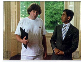
'Holland Casino Speltip 10: Denk goed na voor je inzet'