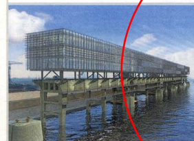
Het Kraanspoor springt in het oog. Hier is onder andere IdTV gevestigd.